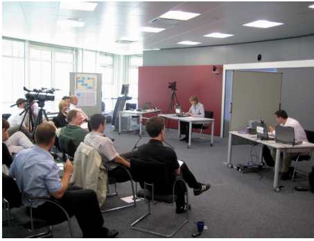
Erprobung neuer Dienstleistungen im ServLab des Fraunhofer IAO